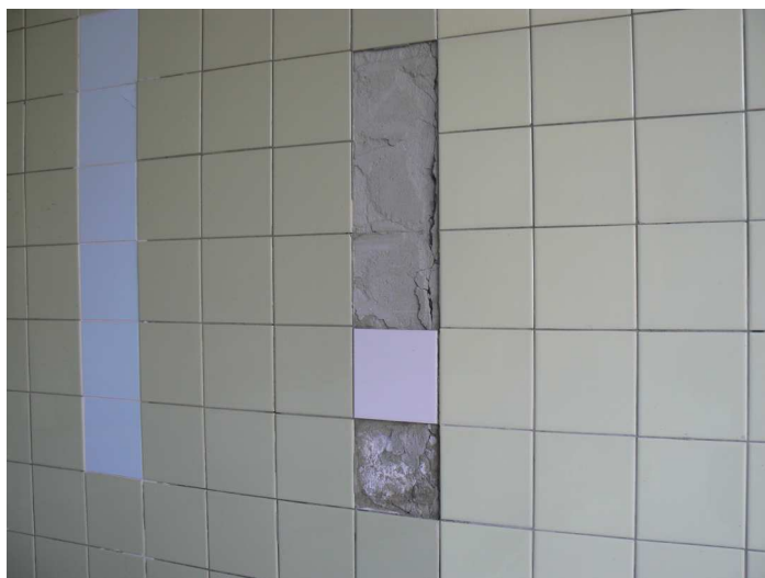
F61 Pohľad na poškodený keramický obklad južnej fasádnej prefa keramzitovej steny bazénovej haly