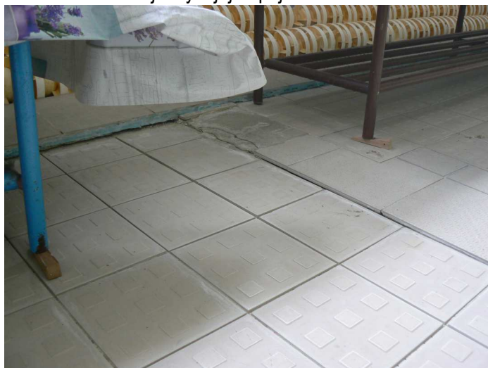
F48 Detailný pohľad na presadnutú podlahu západného okraja bazénovej haly