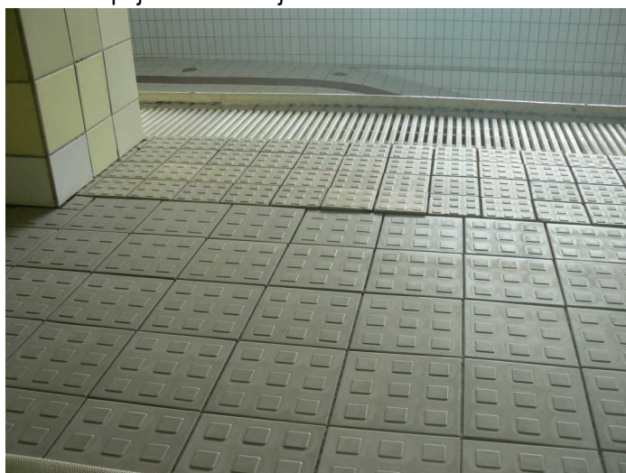
F34 Pohľad na presadenutie podlahy bazénovej haly v jej napojení na vonkajšiu žb. vaňu bazéna