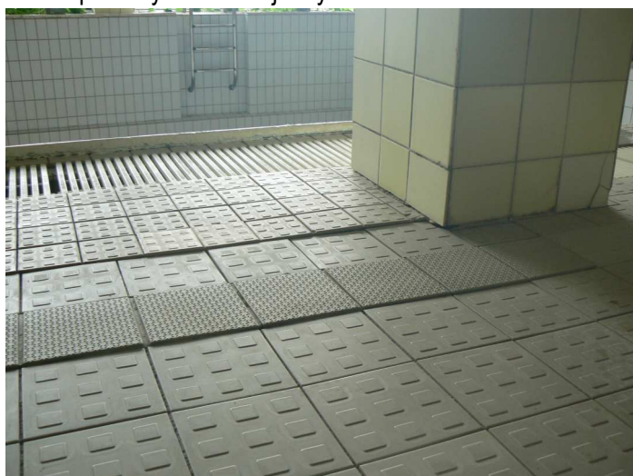
F33 Pohľad na presadenutie podlahy bazénovej haly v jej napojení na vonkajšiu žb. vaňu bazéna