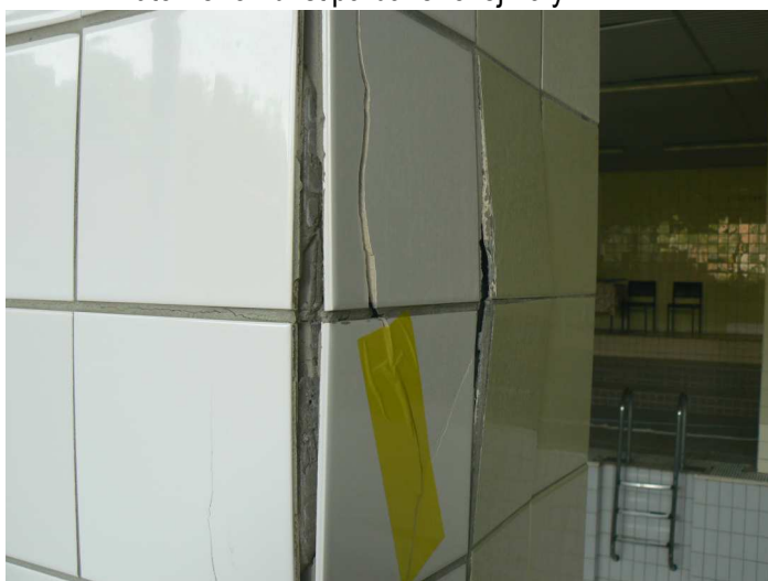
F53 Detailný pohľad na poškodený keramický obklad vnútorného žb. stĺpa bazénovej haly