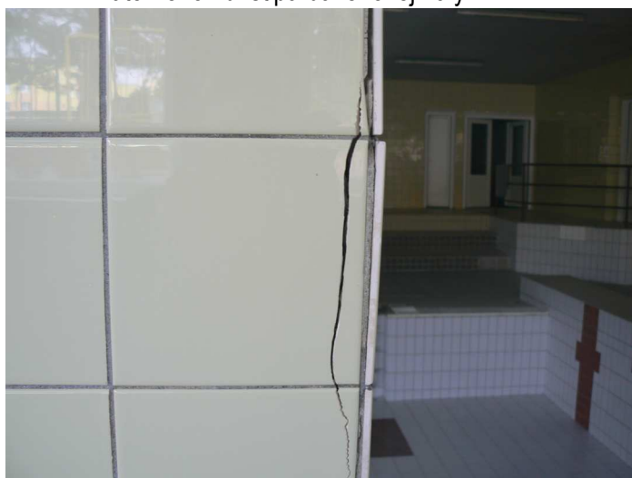
F60 Detailný pohľad na poškodený keramický obklad vnútorného žb. stĺpa bazénovej haly