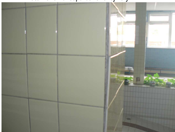
F65 Detailný pohľad na poškodený keramický obklad vnútorného žb. stĺpa bazénovej haly