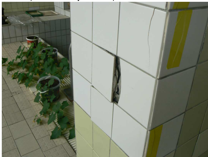
F52 Detailný pohľad na poškodený keramický obklad vnútorného žb. stĺpa bazénovej haly