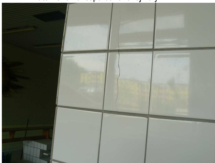
F54 Detailný pohľad na poškodený keramický obklad vnútorného žb. stĺpa bazénovej haly