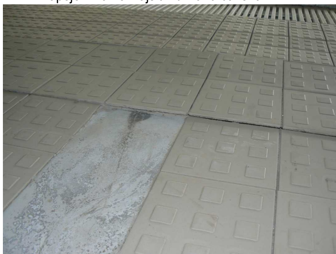
F36 Detail výrazného sadnutia podlahy bazénovej haly v jej napojení na vonkajšiu žb. vaňu bazéna