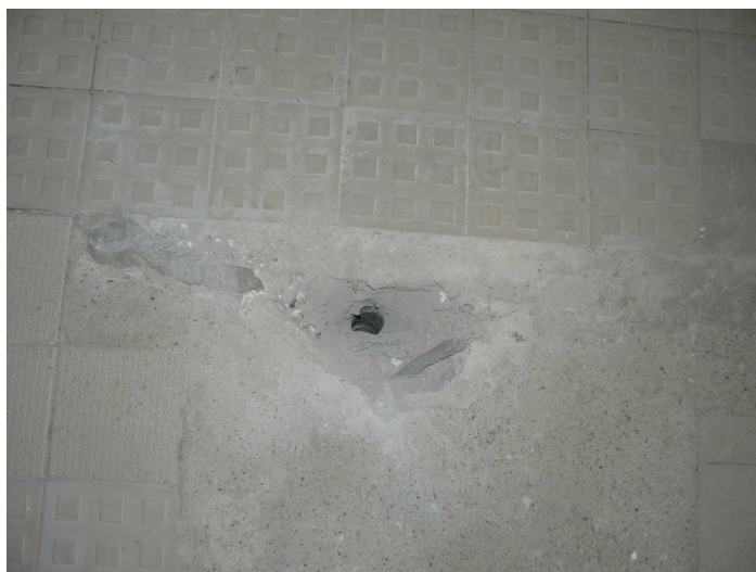
F37 Pohľad na sondu overujúcu exist. skladbu podlahy bazénovej haly s vrtom pre penetračnú sondu "PS6"