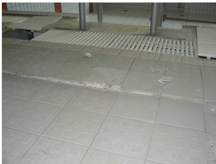
F38 Detail výrazného sadnutia podlahy bazénovej haly v jej napojení na vonkajšiu žb. vaňu bazéna