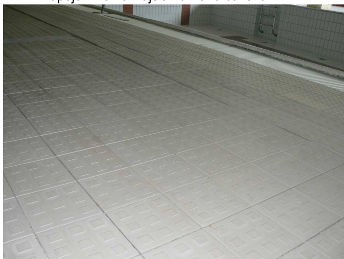
F35 Pohľad na presadenutie podlahy bazénovej haly v jej napojení na vonkajšiu žb. vaňu bazéna