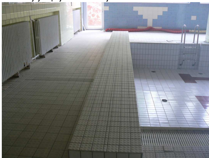
F41 Celkový pohľad na posudzovanú podlahu bazénovej haly na jej južnom okraji