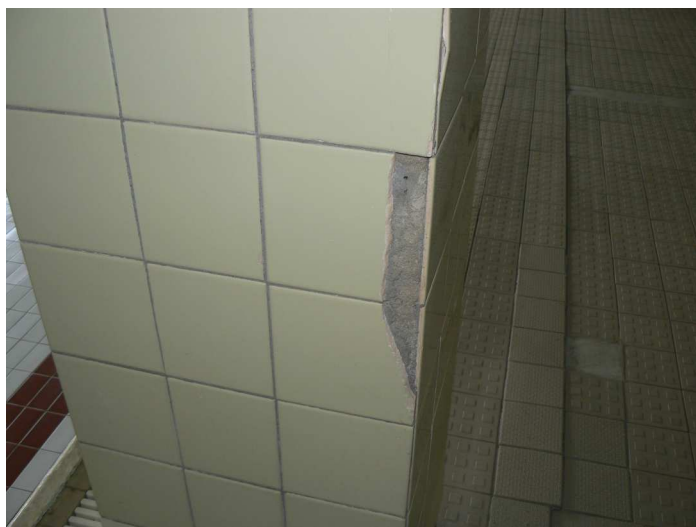
F62 Detailný pohľad na poškodený keramický obklad vnútorného žb. stĺpa bazénovej haly