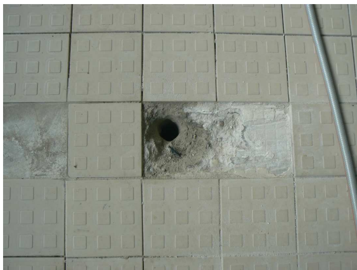
F50 Pohľad na vrt v podlahe bazénovej haly pre prieskumnú dynamickú penetračnú sondu "PS7"