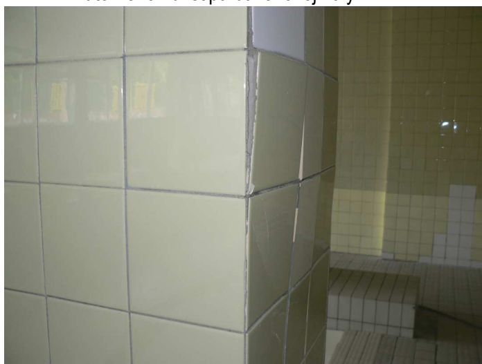
F66 Detailný pohľad na poškodený keramický obklad vnútorného žb. stĺpa bazénovej haly