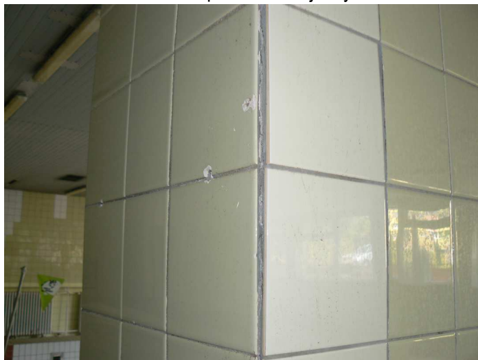
F64 Detailný pohľad na poškodený keramický obklad vnútorného žb. stĺpa bazénovej haly