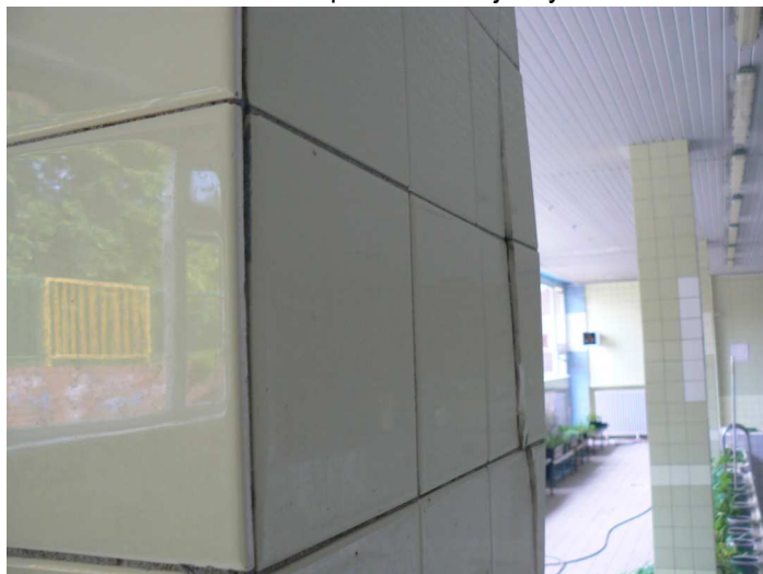
F57 Detailný pohľad na poškodený keramický obklad vnútorného žb. stĺpa bazénovej haly