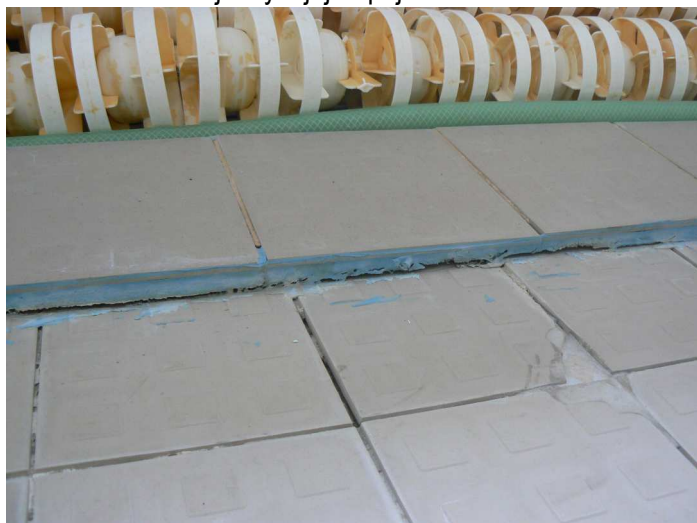
F47 Detailný pohľad na presadnutú podlahu západného okraja bazénovej haly v jej napojení na VZT kanál