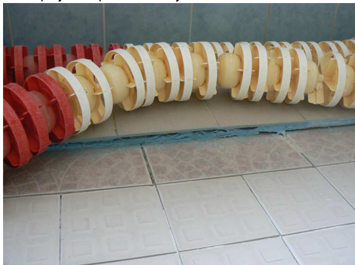
F45 Pohľad na presadnutú podlahu západného okraja bazénovej haly v jej napojení na VZT kanál