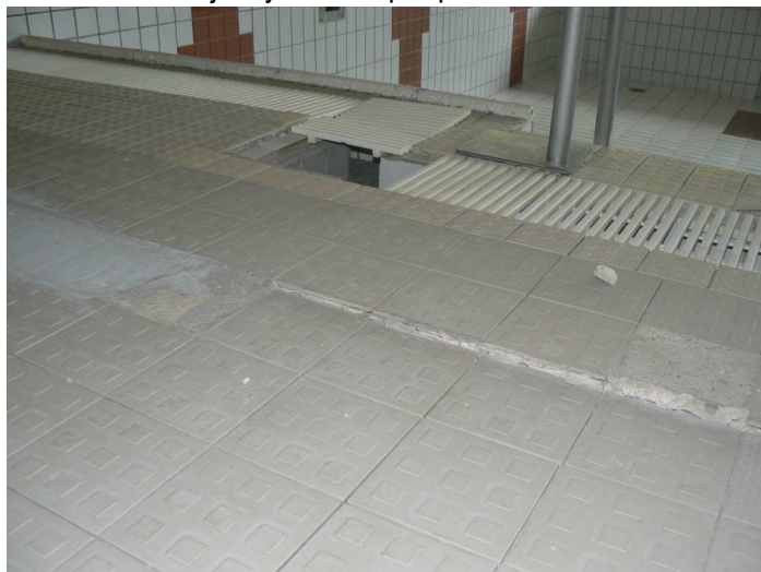
F39 Detail výrazného sadnutia podlahy bazénovej haly v jej napojení na vonkajšiu žb. vaňu bazéna