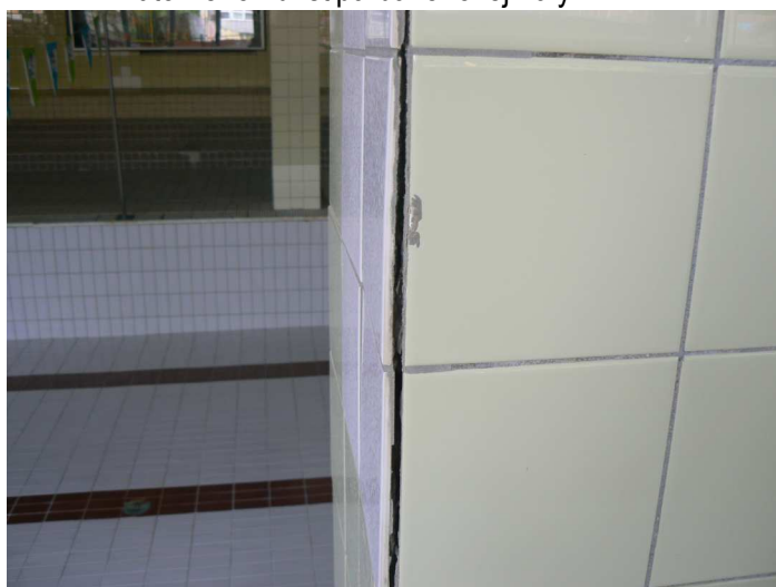
F59 Detailný pohľad na poškodený keramický obklad vnútorného žb. stĺpa bazénovej haly