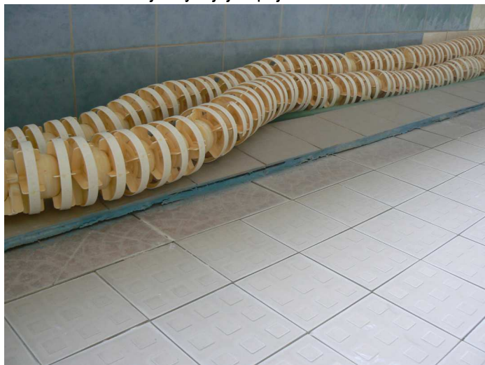
F46 Pohľad na presadnutú podlahu západného okraja bazénovej haly v jej napojení na VZT kanál