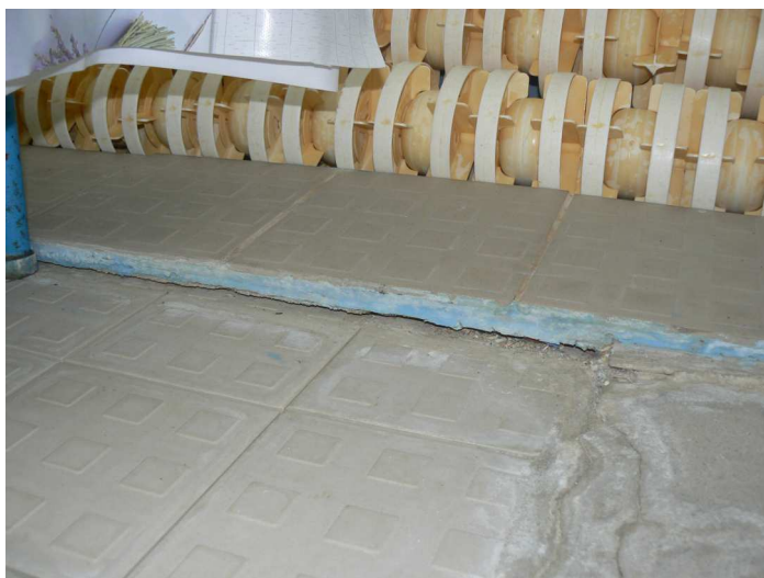
F49 Detailný pohľad na presadnutú podlahu západného okraja bazénovej haly v jej napojení na VZT kanál