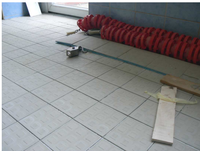
F44 Pohľad na presadnutú podlahu západného okraja bazénovej haly v jej napojení na VZT kanál