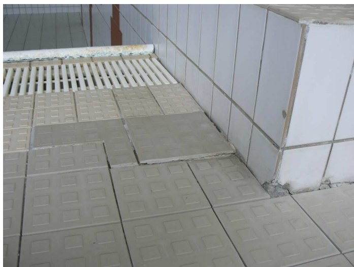
F43 Detailný pohľad na narušenú a presadnutú podlahu pri juhozápadnom okraji bazéna