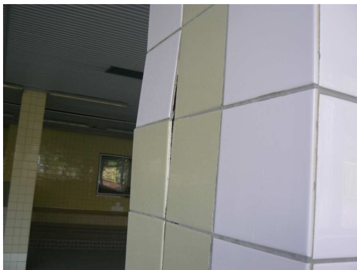
F55 Detailný pohľad na poškodený keramický obklad vnútorného žb. stĺpa bazénovej haly