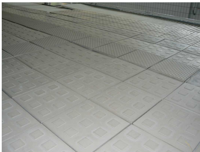
F32 Pohľad na presadenutie podlahy bazénovej haly v jej napojení na vonkajšiu žb. vaňu bazéna