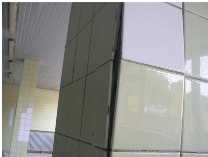
F56 Detailný pohľad na poškodený keramický obklad vnútorného žb. stĺpa bazénovej haly