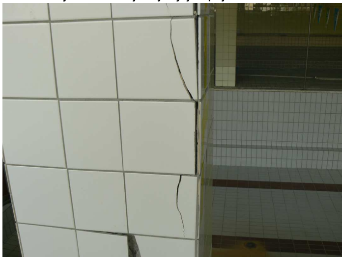
F51 Detailný pohľad na poškodený keramický obklad vnútorného žb. stĺpa bazénovej haly